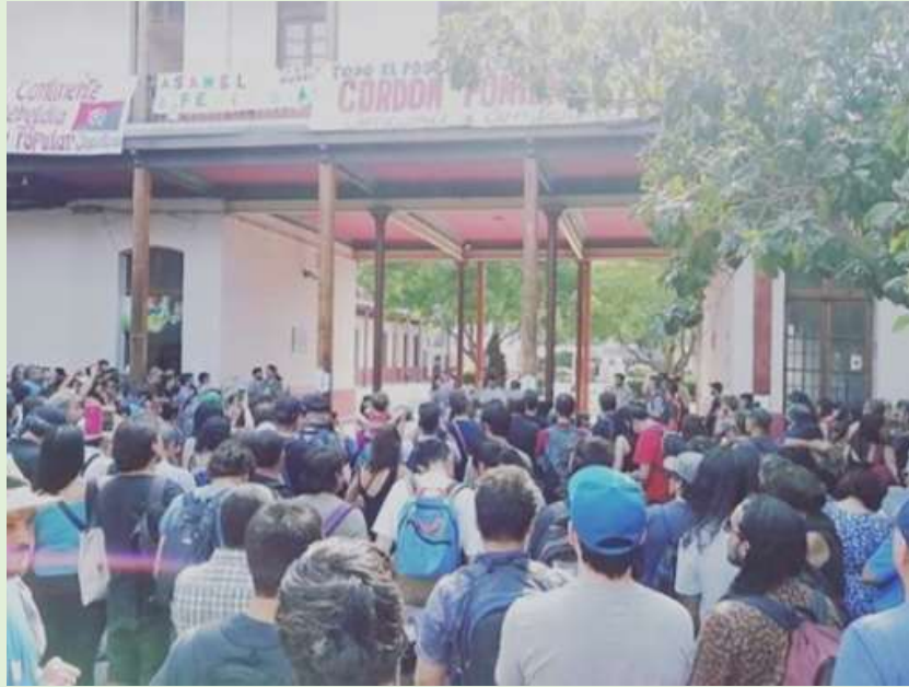
Foto del gran encuentro en los segundos pisos todas las asambleas colgaron sus lienzos, https://rcvo.cl/asambleas-territoriales/