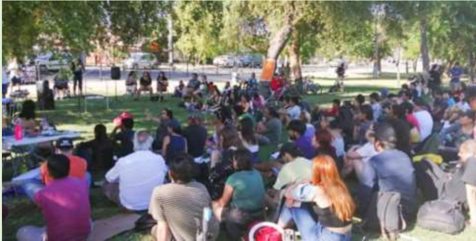
Foto de asambleas, a un año del estallido social reunidas aun, https://interferencia.cl/articulos/resisten-el-presente-de-cabildos-y-asambleas-casi-un-ano-del-estallido-social